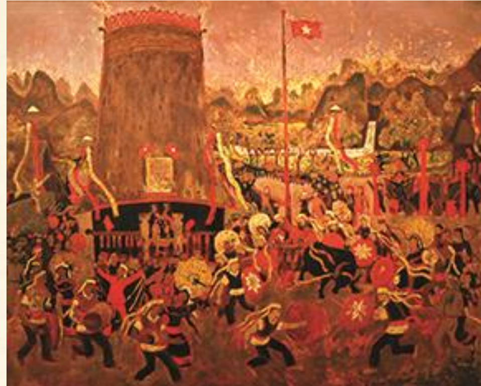
Tác phẩm: Bình minh trên núi rừng Tây Nguyên Tác giả: Xu Man Chất liệu: sơn mài