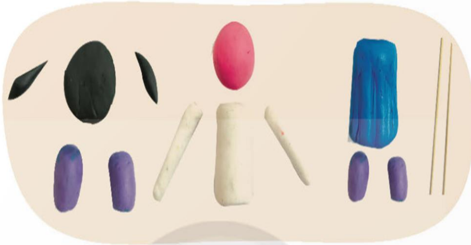
1. Nặn khối cơ bản để tạo các bộ phận của nhân vật.