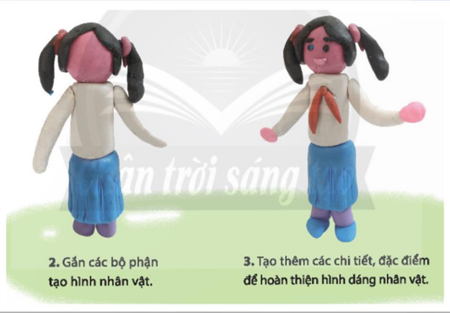
2. Gắn các bộ phận tạo hình nhân vật.