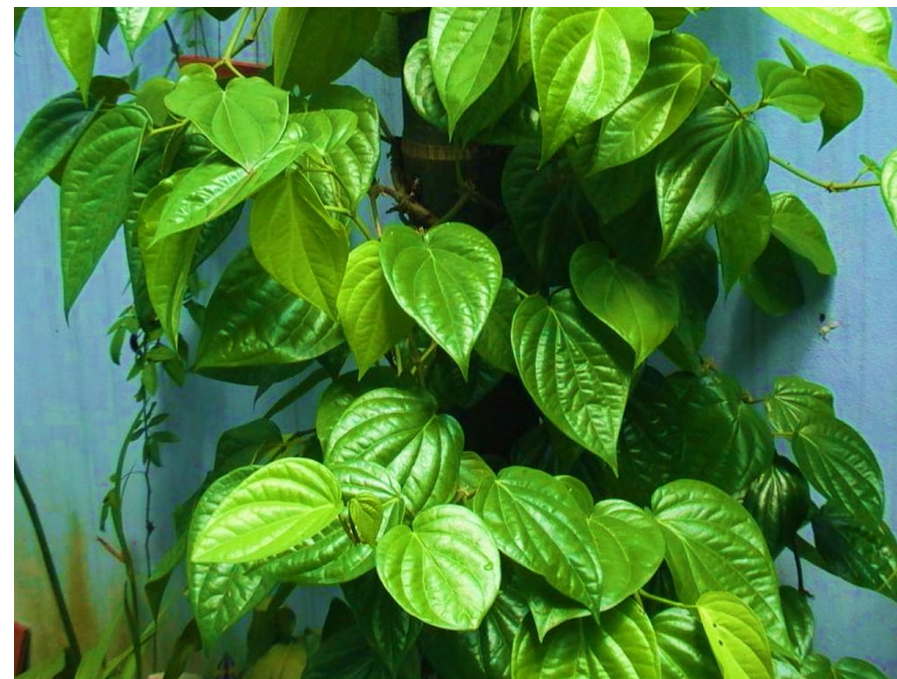
Cây trầu không

Cây thơm mọc ở cạnh nhà Bắc giàn lấy lá cho bà quệt vôi Bảo không mà có đấy thôi Đem nghiền nát với cau tươi đỏ lừ. - Là cây gì?