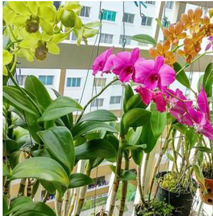
Cây hoa lan