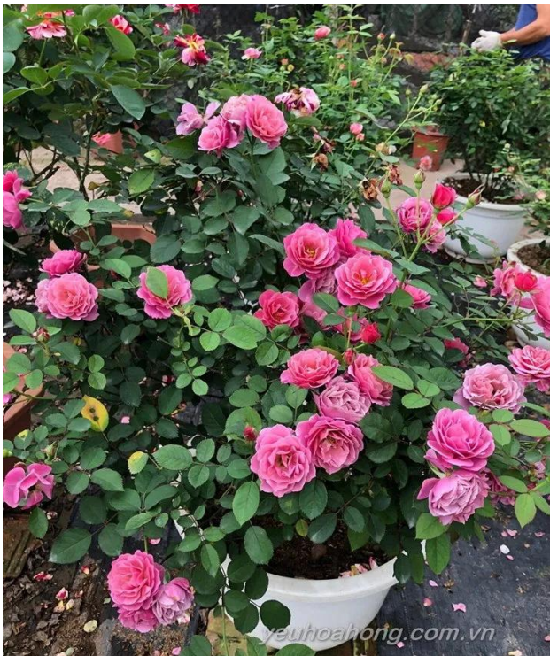
Cây hoa hồng