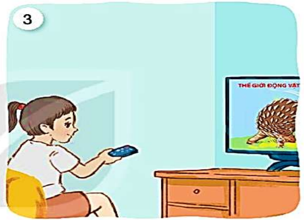
Xem ti vi