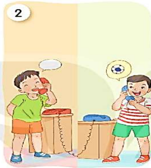
Gọi điện thoại