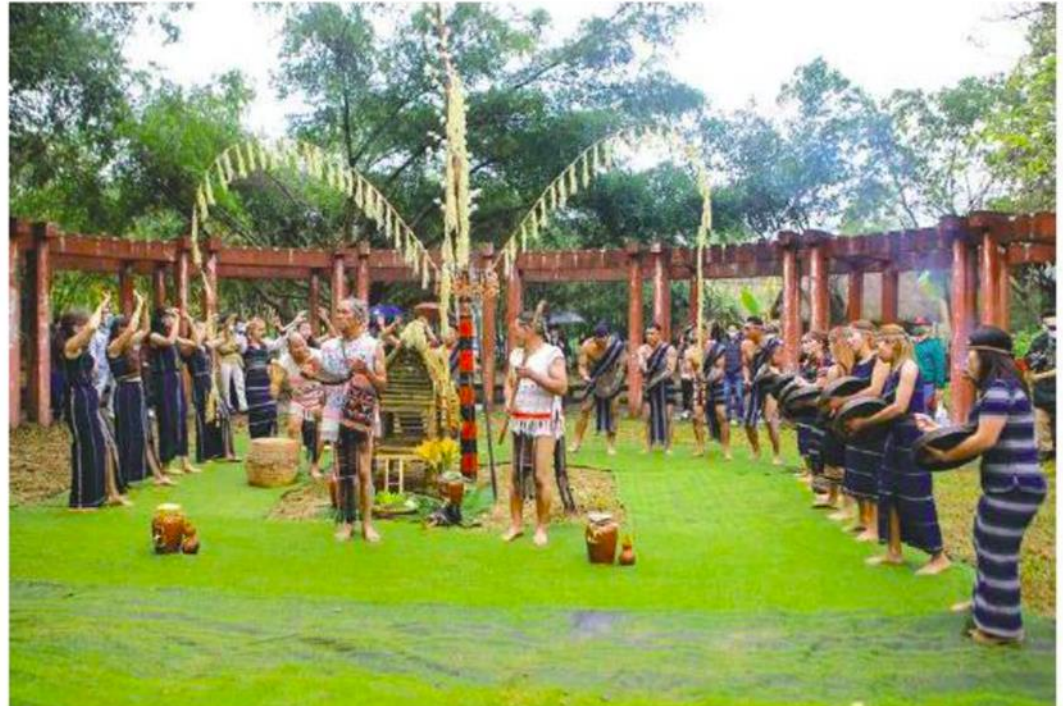
▲ Hình 1. Đánh cồng chiêng trong lễ Mừng lúa mới của dân tộc Cơ Ho (tỉnh Lâm Đồng)

Mừng lúa mới là lễ hội truyền thống của một số dân tộc ở Tây Nguyên, sau khi đã xong mùa màng nhằm tạ ơn thần linh tổ tiên đã ban cho một năm mới mưa thuận gió hòa, mùa màng tươi tốt. Đánh cồng chiêng là hoạt động không thể thiếu trong lễ cúng Mừng lúa mới, dân làng tập trung cùng đánh cồng chiêng, nhảy múa ăn uống, trao đổi kinh nghiệm và chúc nhau sức khỏe, vụ mùa mới bội thu.