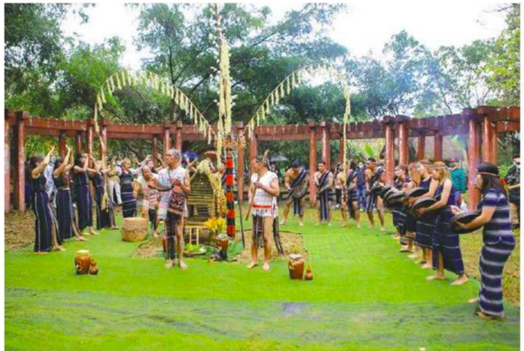
▲ Hình 1. Đánh cồng chiêng trong lễ Mừng lúa mới của dân tộc Cơ Ho (tỉnh Lâm Đồng)