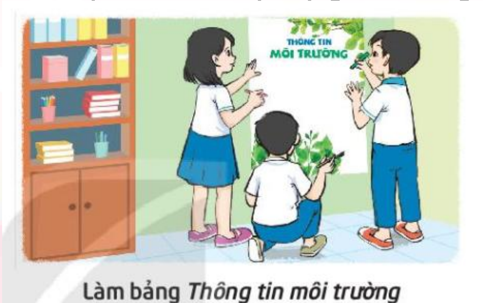
Làm bảng Thông tin môi trường