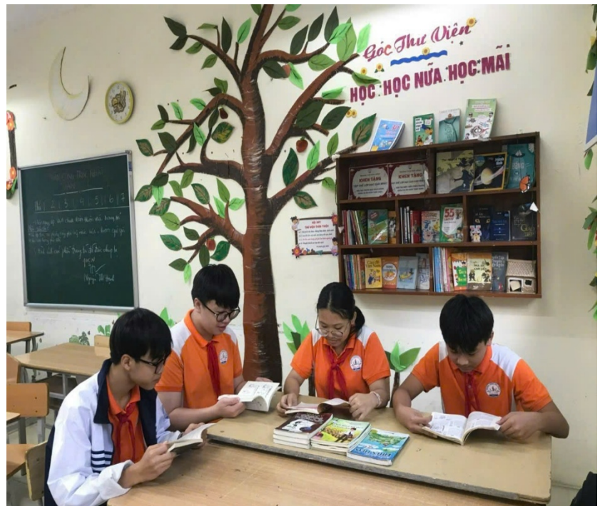
Cô Hoài luôn giữ gìn thư viện ngăn nắp, sạch sẽ