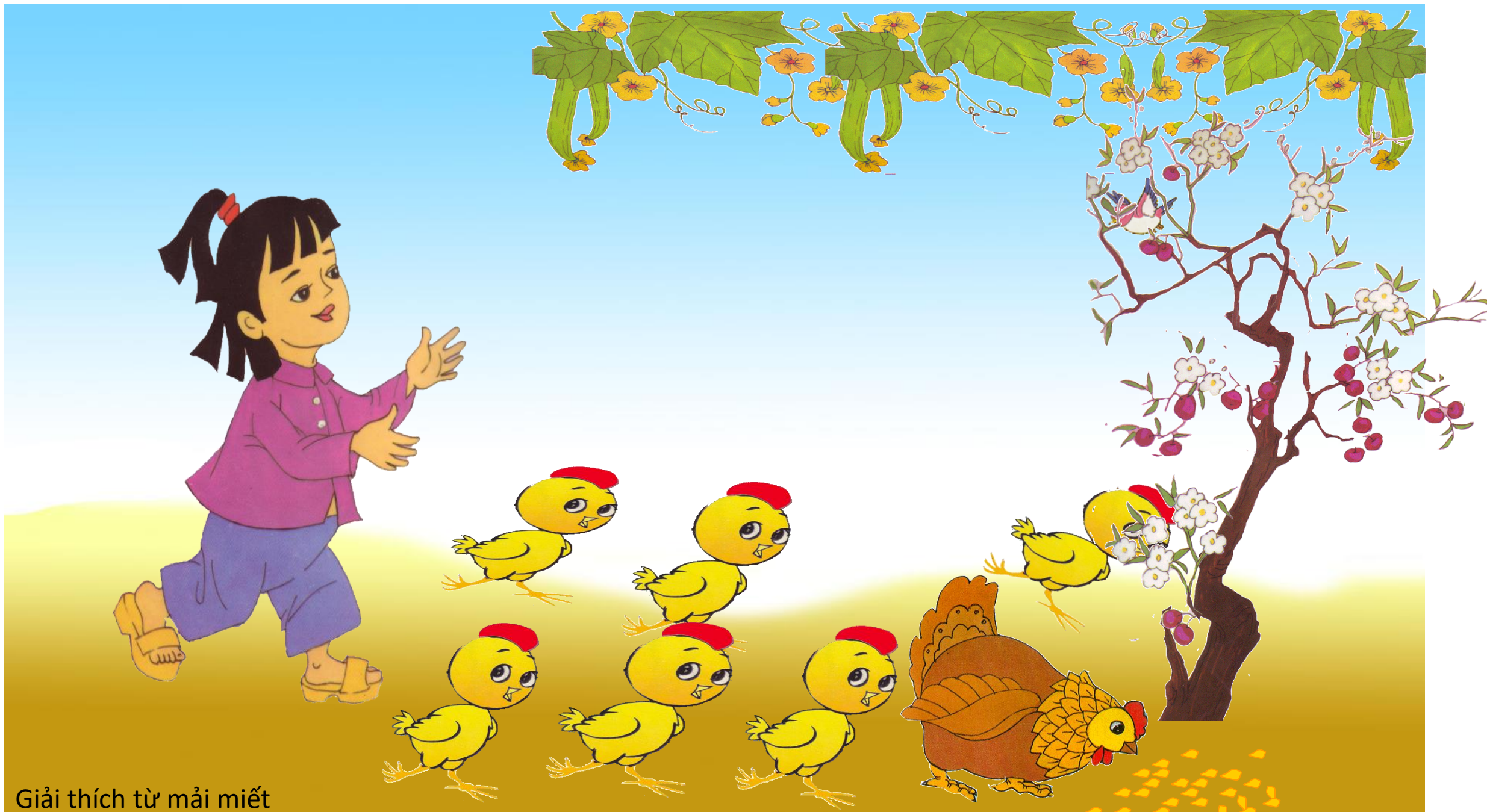
Giải thích từ mải miết