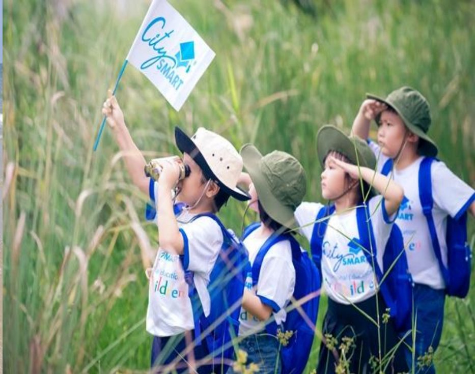
Các hoạt động diễn ra vào mùa hè ?