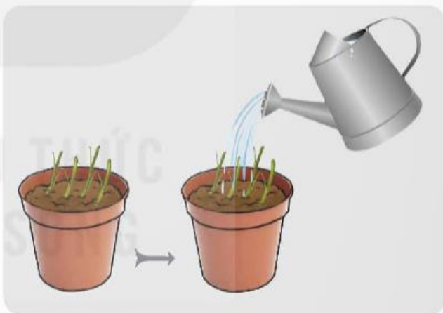
b) Trồng cây bằng đoạn thân (cành)