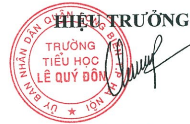
Đồng Thị Quyên