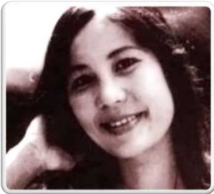
Lâm Thị Mỹ Dạ