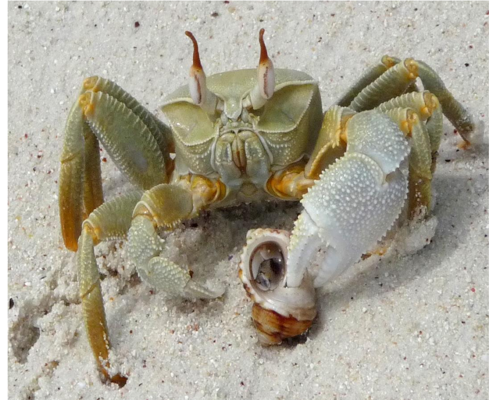
Con còng gió