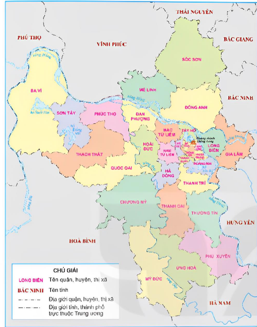
▲ Hình 2. Lược đồ hành chính thành phố Hà Nội

Đọc thông tin và quan sát hình 2, em hãy xác định vị trí địa lí của Thăng Long - Hà Nội trên lược đồ.