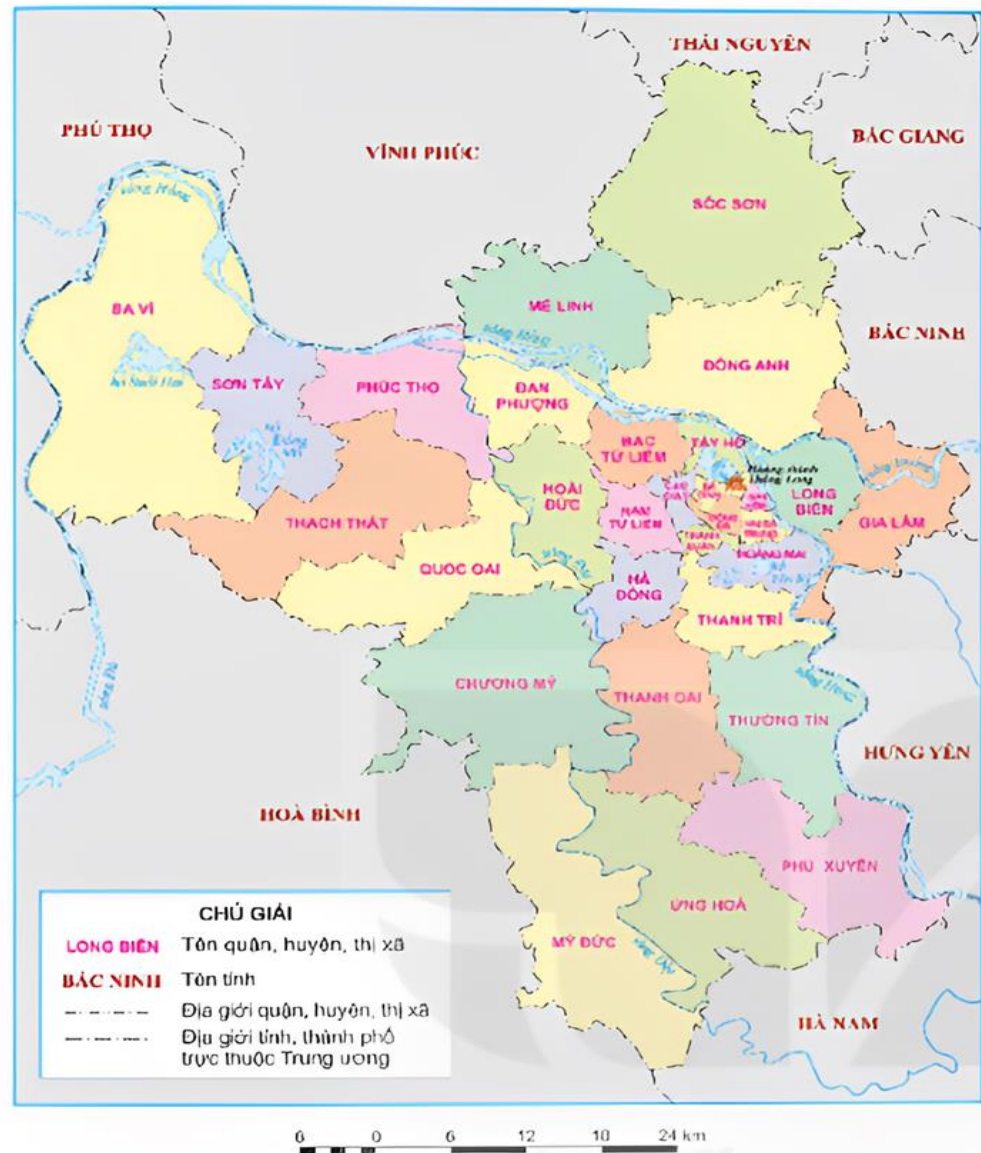
▲ Hình 2. Lược đồ hành chính thành phố Hà Nội

Lược đồ hành chính thành phố Hà Nội: Lược đồ thể hiện vị trí địa lí, không gian của thành phố Hà Nội ngày nay.