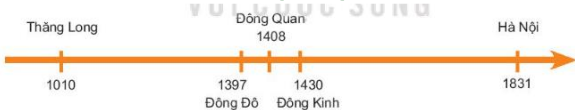
▲ Hình 3. Tên gọi Thăng Long – Hà Nội qua các thời kì lịch sử